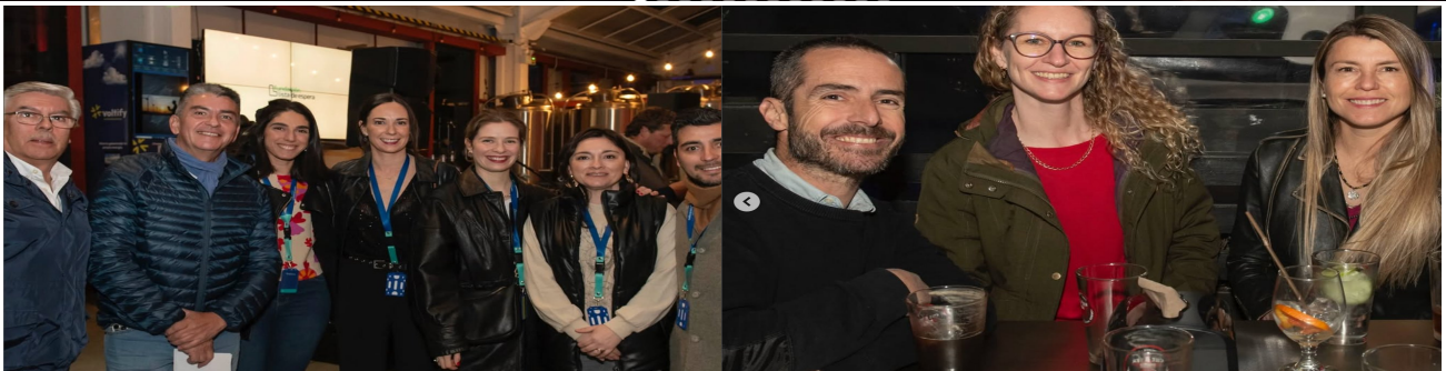
Café Concert 2025 — Puerto Varas · Septiembre 2025